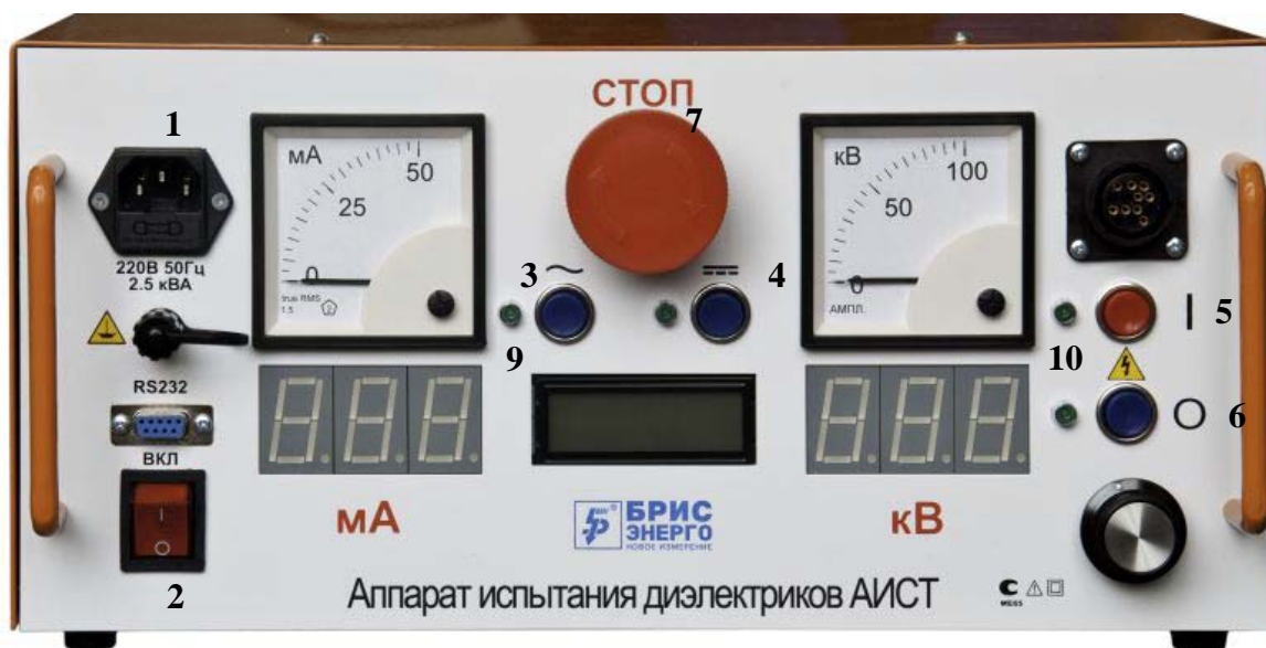
Рисунок 2 Пульт управления